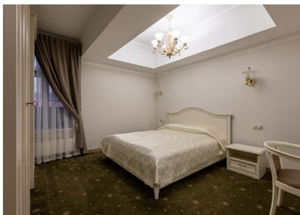
5 этаж 98 500 ₽