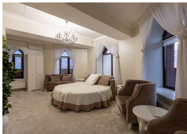
9 этаж 98 500 ₽