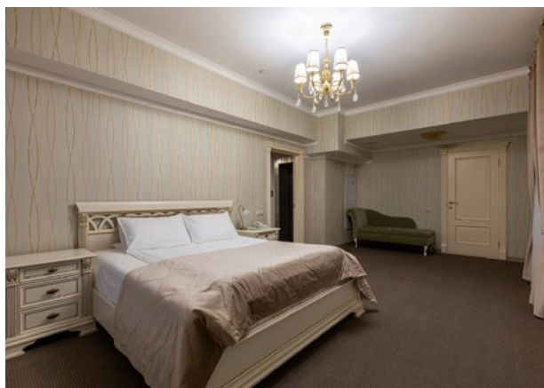
7 и 8 этажи 102 900 ₽