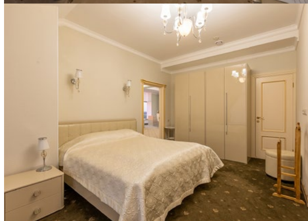
6 этаж 157 000 ₽ (для одного) 210 000 ₽ (для двоих)