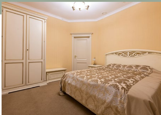
2 и 3 этажи 92 000 ₽